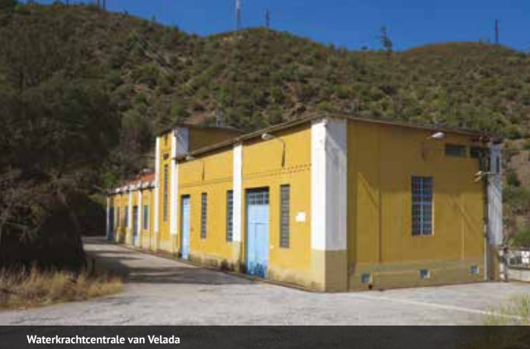
Waterkrachtcentrale van Velada