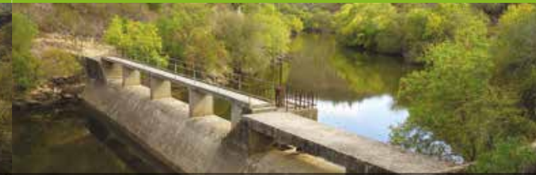
Ponton van de dam