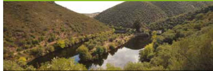
Schiereiland gezien vanop het uitkijkpunt