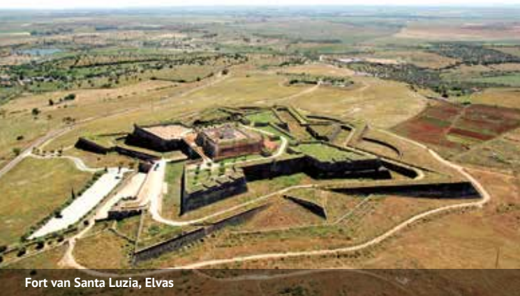
Fort van Santa Luzia, Elvas