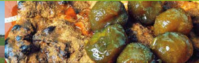
Pruimen van Elvas (BOB - beschermde oorsprongsbenaming)