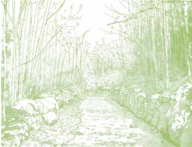
Lopen over de oude middeleeuwse weg die de verbinding was tussen Castelo de Vide en Marvão.

Deze route is de historische verbinding tussen twee strategische punten: Castelo de Vide en Marvão. We lopen door karakteristiek plattelands- en natuurgebied, over oude wegen waarvan een deel van de middeleeuwse bestrating nog intact is en wordt geflankeerd door muurtjes. We passeren talloze boerderijtjes waar men zich hoofdzakelijk bezighoudt met olijventeelt en extensieve veeteelt. Regelmatig worden we begroet door het blaten van de alom aanwezige schapen. Opvallend is ook het grote aantal Portugese eiken, die van groot ecologisch belang zijn voor deze regio. Langs de landweggetjes treffen we her en der karakteristieke bouwsels aan die stammen uit lang vervlogen tijden, waaronder oude fontein, een hut, kerken en een in de rotswand uitgehakt graf. De laatste 3 kilometer stijgen we voortdurend, een ware beproeving voor ons uithoudingsvermogen. Dit wordt ruimschoots goedgemaakt door de schoonheid van het omringende landschap dat zich tot ver aan de horizon voor ons uitrolt, en door de prachtige en goed geconserveerde middeleeuwse bestrating waarover we door de kastanjebossen worden geleid. De streek rondom Marvão is beroemd om zijn kastanjes, getuige ook het beschermde product Castanha de Marvão . Op meer dan 800 meter hoogte bereiken we het eindpunt van de route, bij de Poort van Ródão, de toegangspoort tot het plaatsje Marvão.