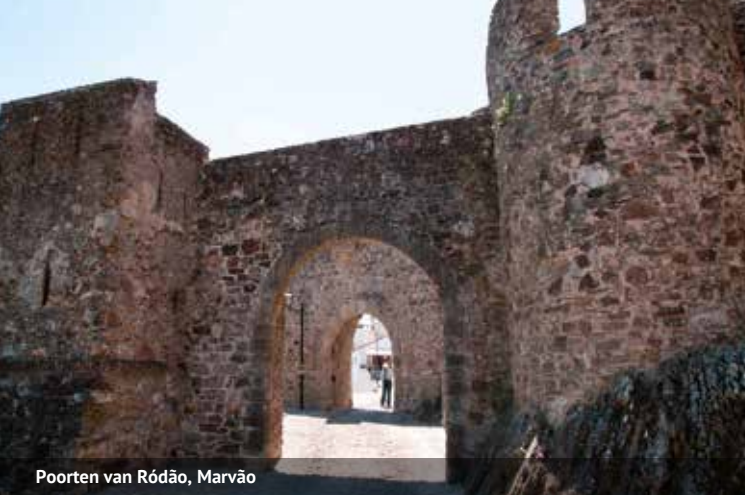
Poorten van Ródão, Marvão