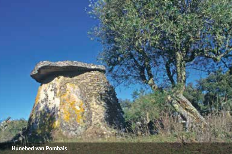
Hunebed van Pombais