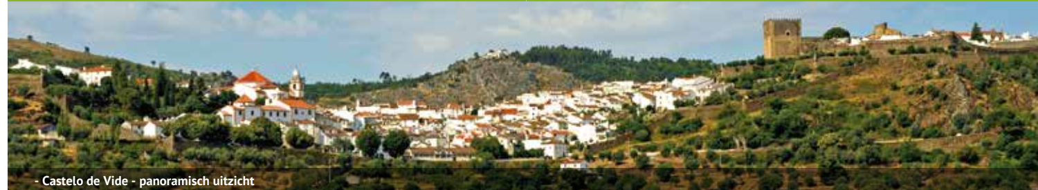
- Castelo de Vide - panoramisch uitzicht