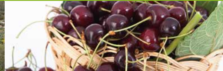
Kers van São Julião (BOB - beschermde oorsprongsbenaming)