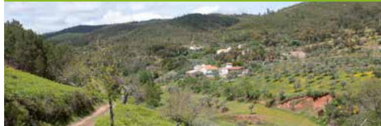
Omgeving rond het dorp Pinheiros