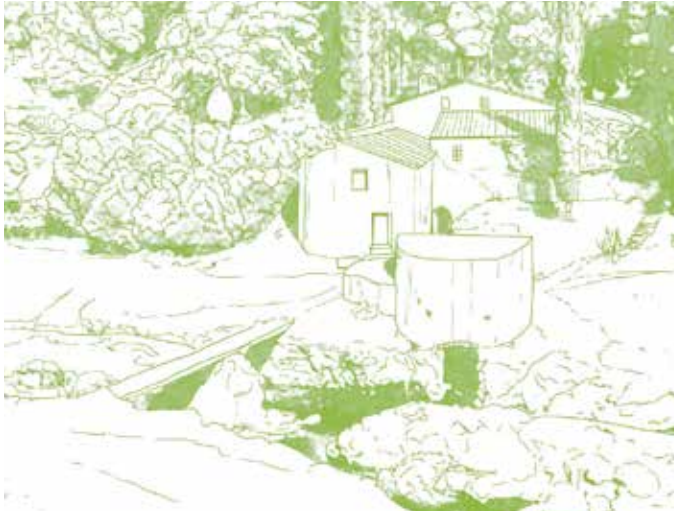
De watermolens van Tramaga. Toen de watermolens onmisbaar waren voor de voedselvoorziening.

Het grootste deel van deze route volgen we de loop van de rivier Sor, door een decor van kurkeiken. We starten op het hoogste punt van het riviergebied. We steken via de voetgangersbrug de rivier over, waarna we de linkeroever volgen, waar we het grootste deel van de route zullen blijven lopen. We lopen met de stroom mee en gaan de stadsbrug over. Daarna volgen we een zandweggetje, dat na enige tijd bij de volgende voetgangersbrug uitkomt, over de rivier van de vallei Bispo. We blijven stroomafwaarts lopen, en komen door meer landelijk gebied, waar goed gebruik wordt gemaakt van de nabijheid van het water. Daarna begint onze route te stijgen. Op deze kleine vlakte lopen we door een woud van kurkeiken, tot aan het begin van het dorp Ervideira, het meest zuidelijke punt van onze route. We dalen weer af en keren terug naar de oever van de rivier Sor, die we nu in tegenovergestelde richting, stroomopwaarts, volgen. Langs de route komen we oude molens tegen, de molens van Tramaga. Met het hydraulische mechaniek van deze molens werd vroeger het graan gemalen tot meel om brood mee te bakken. In dit natuurgebied van de rivier vermengt het geluid van het stromende water zich met het gezang van de vogels. We komen terug bij de brug over de rivier Sor, die we oversteken, en dalen af naar het oeverpark, waar het aangenaam vertoeven is. We lopen weer langs de oever van de rivier en passeren verschillende gebouwen, waarna de route eindigt op het punt waar we begonnen zijn.