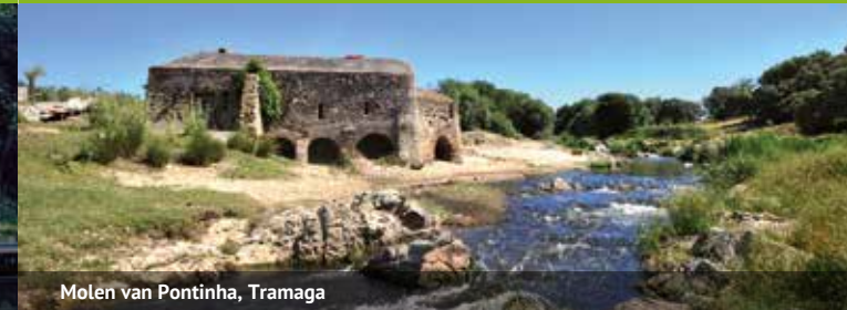
Molen van Pontinha, Tramaga