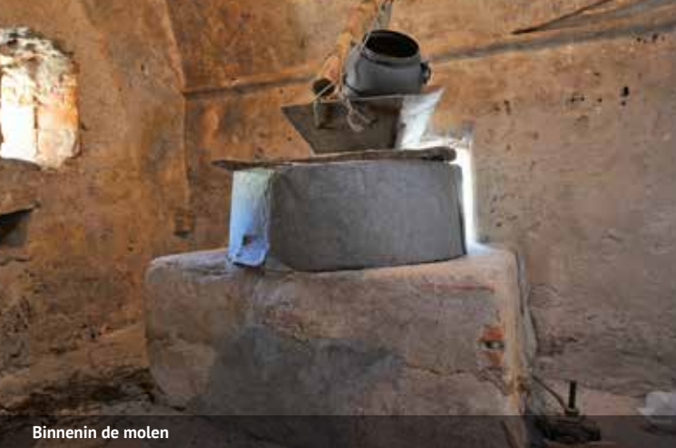
Binnenin de molen