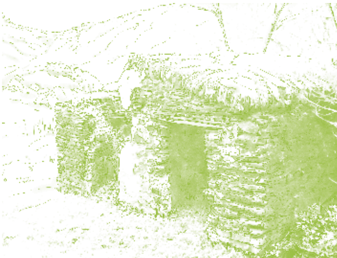
Watermolen van de Witte Molen. Dichtbij de Severrivier, een ideale plaats om te lunchen en even uit te rusten.

De route begint in Montalvão, een plattelandsdorp op een hoge berg die uitzicht biedt op het landschap van de Alentejo, Beira en Spanje. Er wordt een bezoekje gebracht aan de historische zone, het kasteel, de parochiekerk en de dorpsoven. De route volgt de straat Montalvão - Póvoa e Meadas, verlaat het dorp en slaat de eerste straat links in naar de steile randen van de Severrivier. Hij steekt paden over die vroeger werden bewandeld door landbouwers en smokkelaars. Daarna loopt de route langs Chafariz de Pales , Tapada da Queijeira en door Alto da Pobreza. Dit biedt een mooi panorama over de monding van de rivier São João.