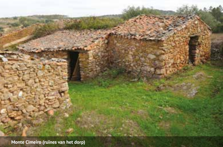
Monte Cimeiro (ruïnes van het dorp)